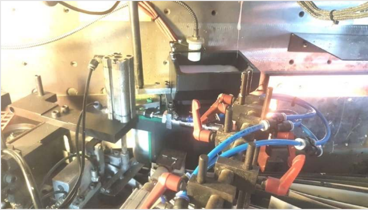
IMA mit offenem Vorschmelzer