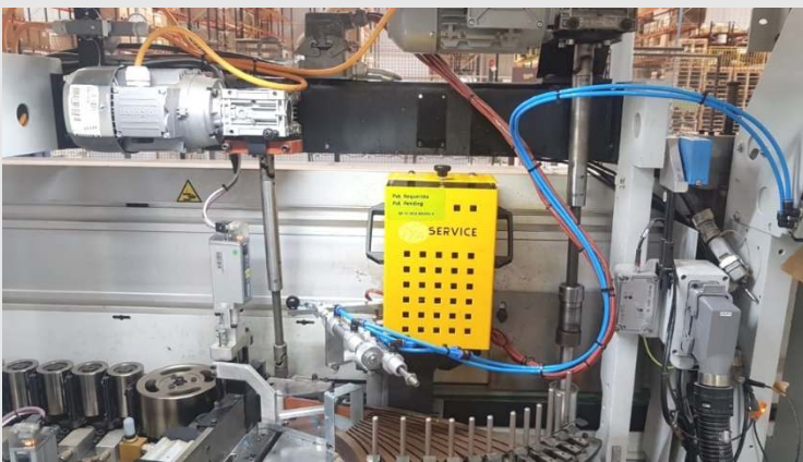
Biese – Verleimteil nach 10-monatigem Einsatz