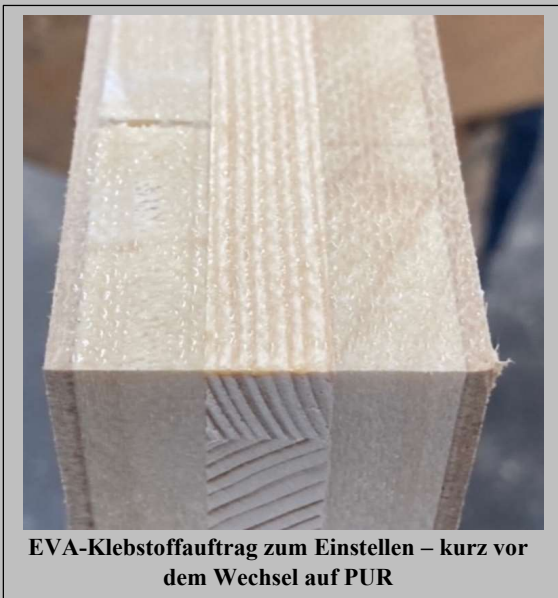
EVA-Klebstoffauftrag zum Einstellen – kurz vor dem Wechsel auf PUR

Das Besondere: der PUR Klebstoff verblieb im Verleimteil, lediglich die Auftragswalze wurde am Freitagmittag in ca. 3-5 Minuten gereinigt. Weder wird PUR-Kleber durch Entleeren verschwendet noch sind besondere Maßnahmen wie Stickstoff- oder Vakuumbox vonnöten.